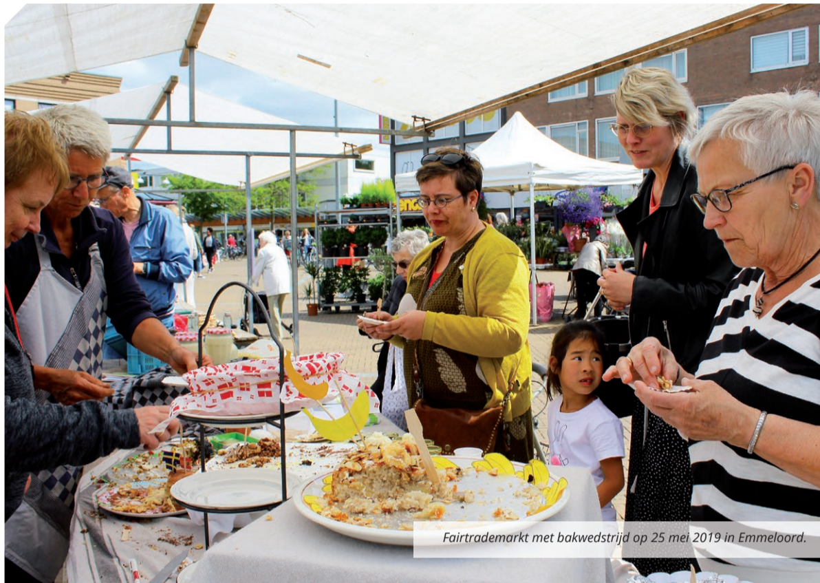
Fairtrademarkt met bakwedstrijd op 25 mei 2019 in Emmeloord.